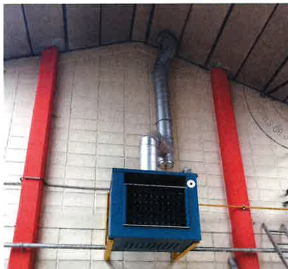
Cliché N° 8

L'aérotherme de marque WANSON, présent contre le mur Nord n'est pas en état de fonctionnement car non raccordé aux réseaux ( Voir le Cliché N° 8 ).