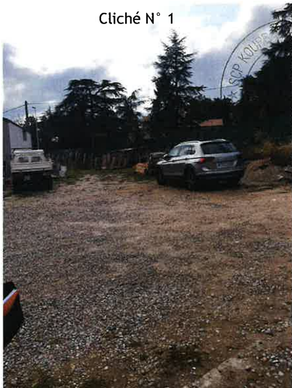
Cliché N° 1