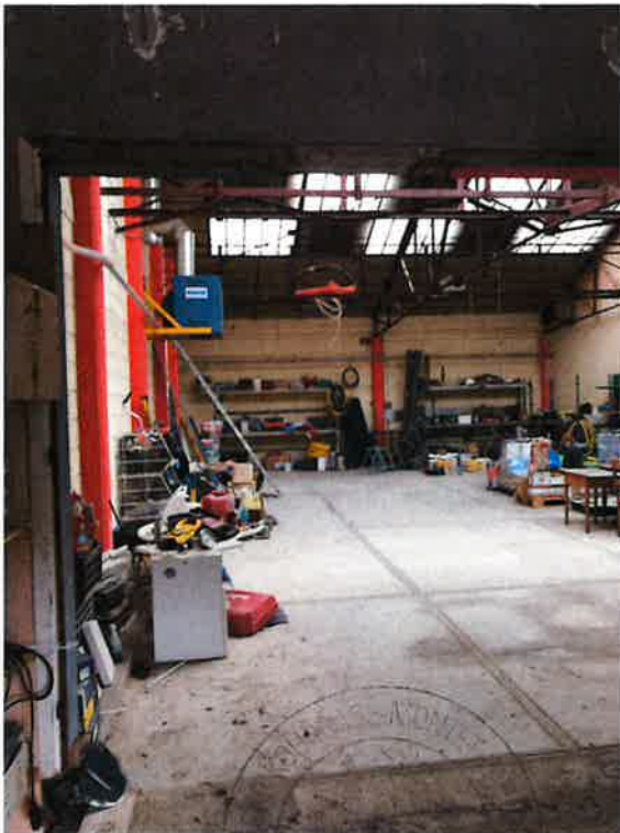
Cliché N° 3