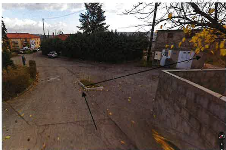
Capture N° 3