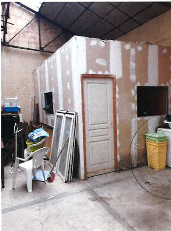
Cliché N° 6