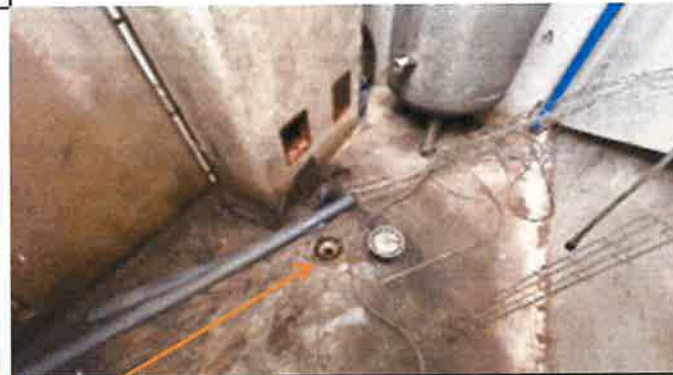
siphon de sol au local compresseur raccordé au réseau pluvial de la propriété

La couleur orange indique une erreur, un dysfonctionnement sur la séparation entre les réseaux d'eaux usées et pluviales