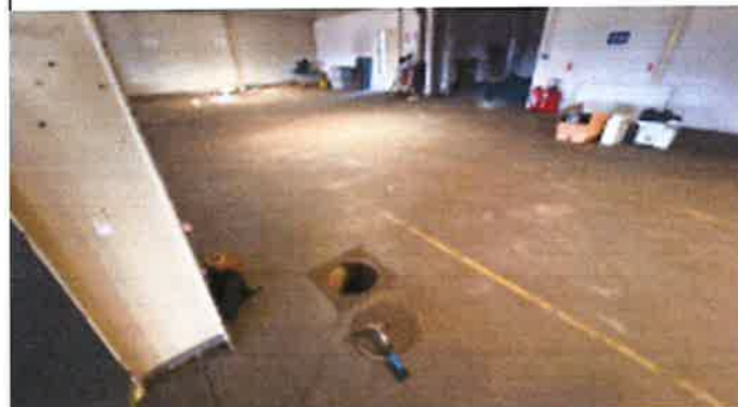
regard pluvial 01 à l'intérieur du bâtiment