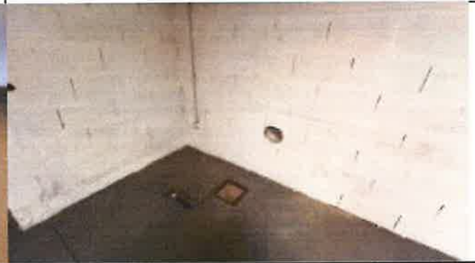
regard pluvial 02 à l'intérieur du bâtiment