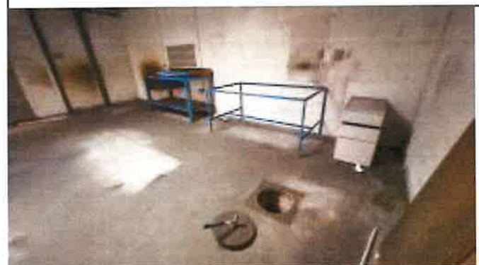
regard pluvial 03 à l'intérieur du bâtiment