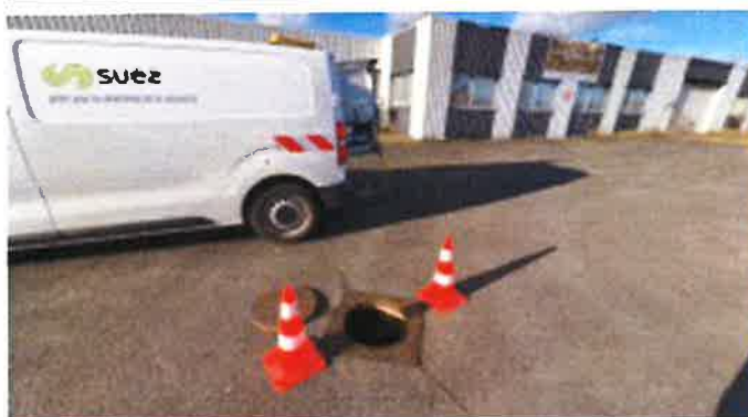
regard de visite collectant l'ensemble des eaux usées de la propriété