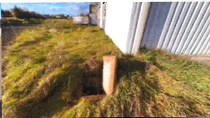
regard pluvial à l'extérieur du bâtiment