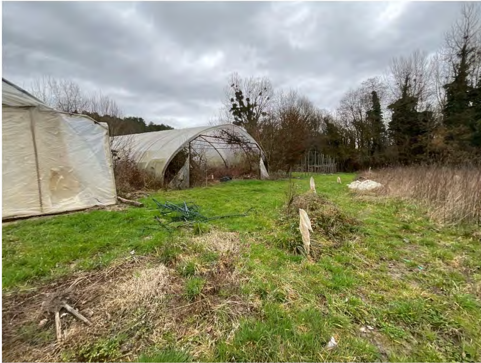
Des ronces poussent entre deux serres tunnel.