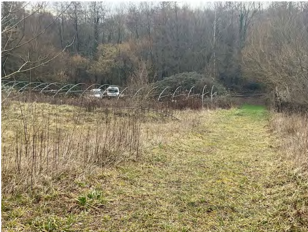
Ce chemin conduit vers un plan d'eau.